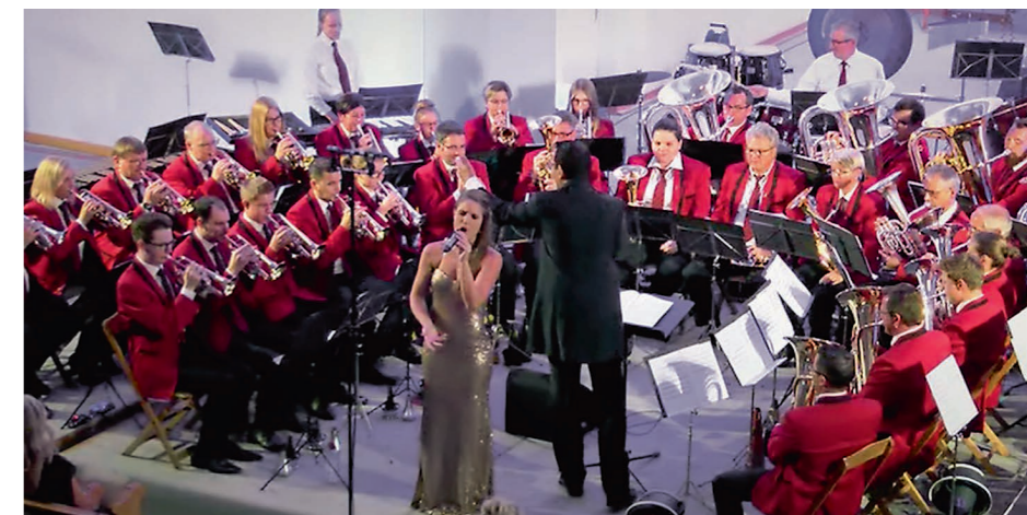
«Aus der Region – für die Region»: Die Musikgesellschaft Hörhausen setzt mit bekannten Gastsolisten die Ostschweiz ins Rampenlicht.

Die meisten Gastsolisten haben einen Bezug zur Ostschweiz – Hörhausen ist ein Dorf